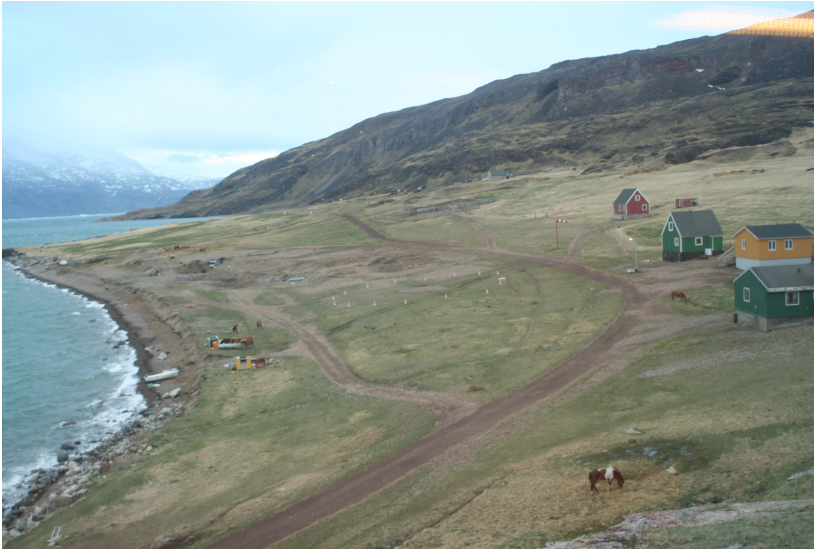
Ruingruppen set fra nord. Heliporten ses i billedets midte markeret med rød- og hvidstribede kegler.

Ruinen måler 4 gange 8 meter. Dens mure hæver sig omkring 30cm over det omgivende terræn.