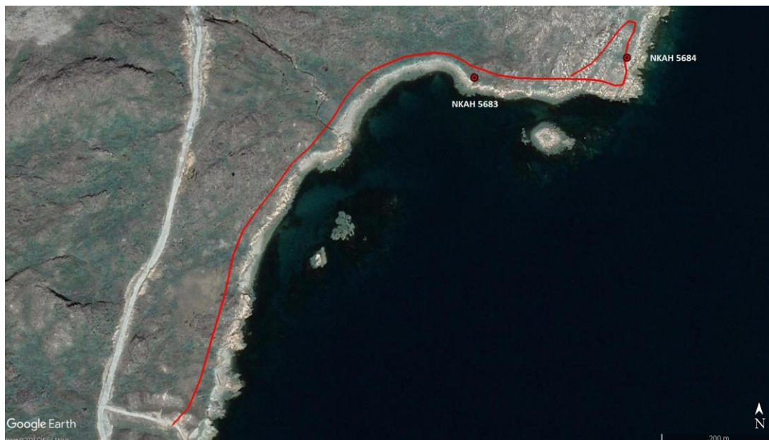
Figur 2. Google Earth kort med angivelse af den besøgte strækning og de to identificerede lokaliteter NKAH 5683-84.