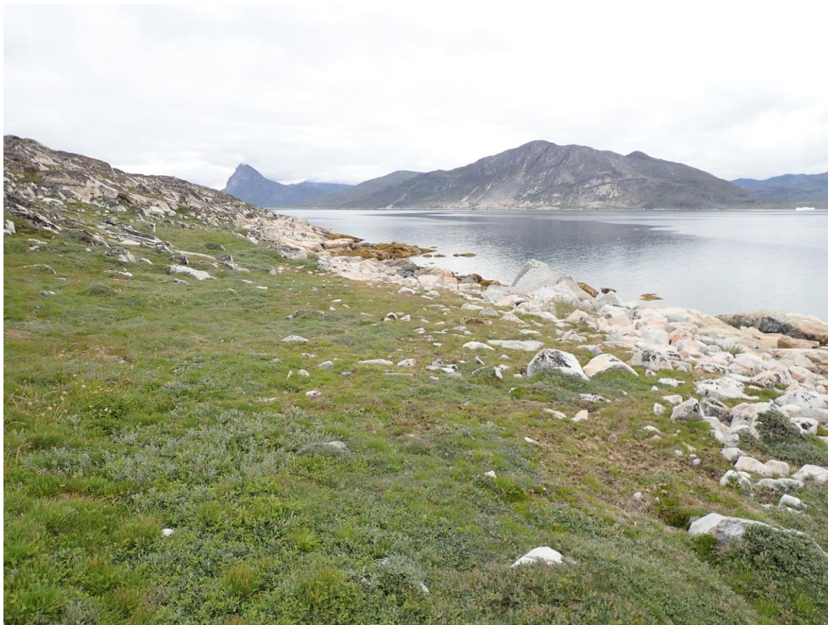
Figur 4. Foto set imod nord af teltfundamentet ved lokalitet NKAH 55

På en jævn græsbevokset flade lige over fjorden findes en mængde stenspor og –forløb, der ser ud til at være resterne af i hvert fald ét stort teltfundament af uvis alder, men dog må regnes for et fortidsminde. Teltfundamentet er afsat som en dobbelt række af mellemstore, fladlige sten - ca. 60-70 cm bredt – der ligger forholdsvis højt i fladen. Der er antydning af enstensat briksekant parallelt med bagvæggen.