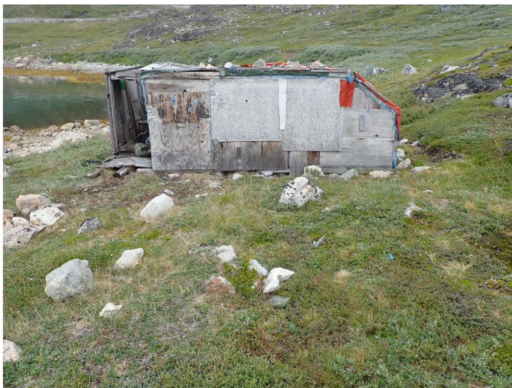
Figur 3. Foto af stenfundament NKAH 5683 og stående fangsthytte set imod vest.